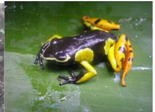
Mantella baroni d'Amparihimazava

Quelques individus hybrides, autour de 10 durant 5 jours de recherche ont été observés par l'équipe de Franco Andreone en 2003. En outre, durant la descente de terrain faite par l'équipe de Conservation International au mois de mars 2008, on a capturé un individu