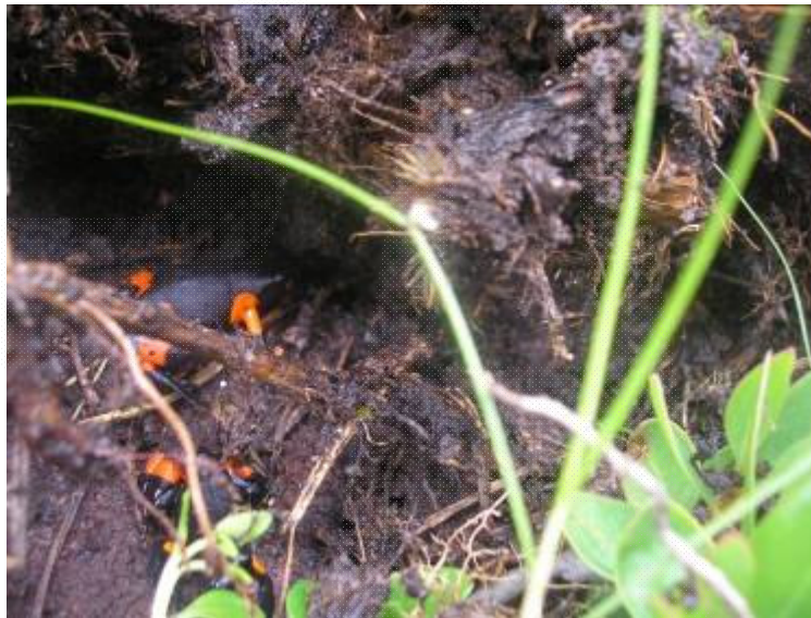
Mantella cowani sous des monticules (fin mars 2008, Fohisokina)

Elle est plutôt actif très tôt le matin et à la fin de l'après-midi pour éviter la forte insolation.