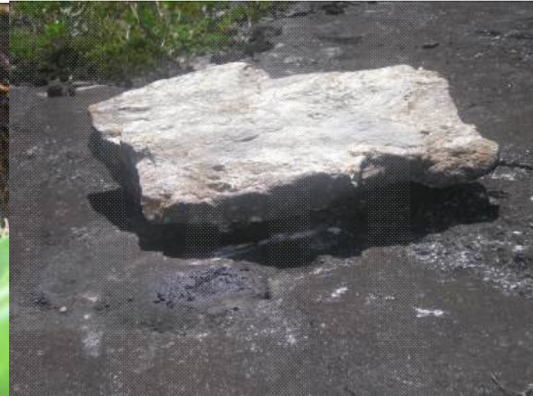
Ce rocher sert d'abris au Mantella cowani (voir la partie humide qui constitue ses fèces, Soamasaka)