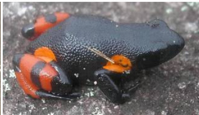
Hybride de Fohisokina